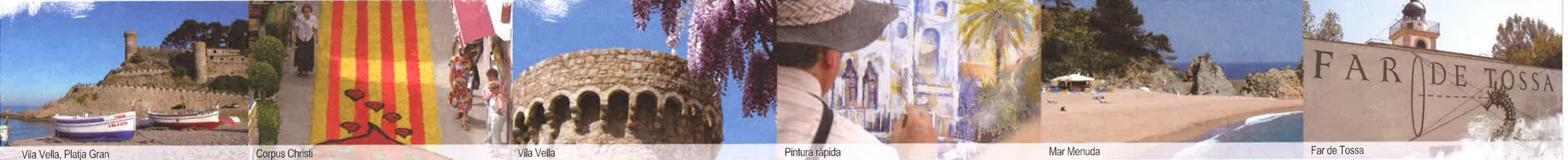
Vila Vella, Platja Gran