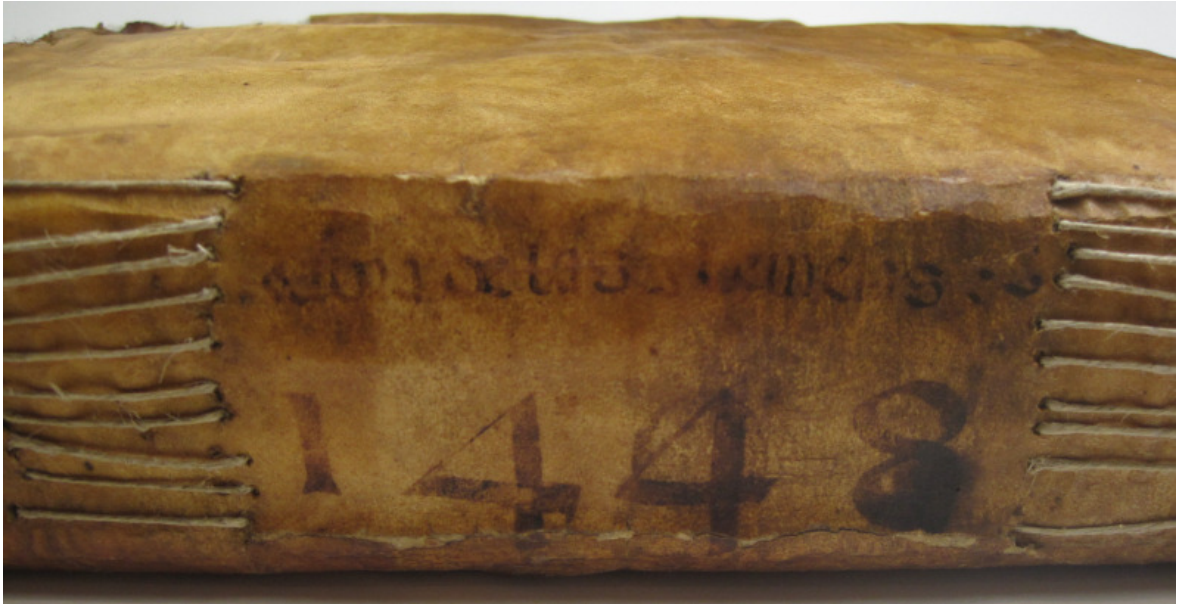
AMGi, Col·lecció Ajuntament de Girona, Llibre del Sindicat Remença de 1448 (llom).