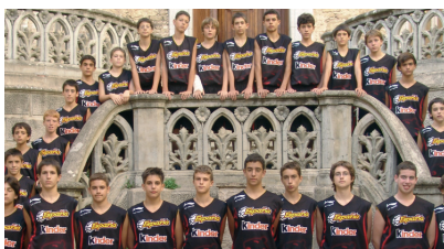
2006 SANTA MARÍA DE COLLELL U12