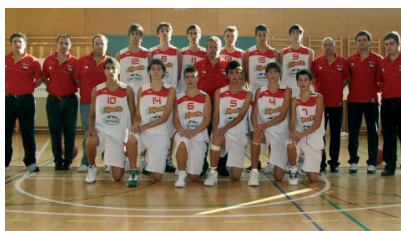
2008 TORNEO BAM U14